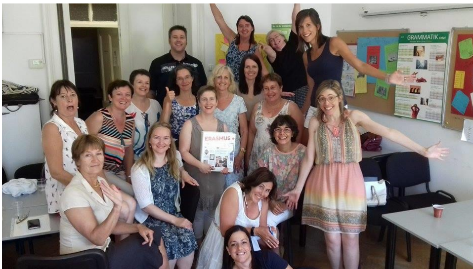
Tervitused rahvusvaheliselt BEATSi tiimilt, kuhu kuuluvad õpetajad ja koordinaatorid (siin: Horvaatias, Rijeka linnas)!

Kursus koosneb 80 tunnist (Rapla Keeltekoolis toimub 40 kontakttundi kohapeal ning lisaks 40 tundi individuaalset tööd internetis asuva Moodle'i keskkonna toel).